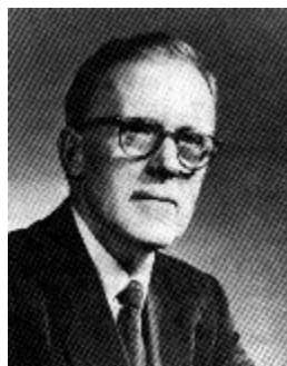
Профессор д-р Дональд Хебб