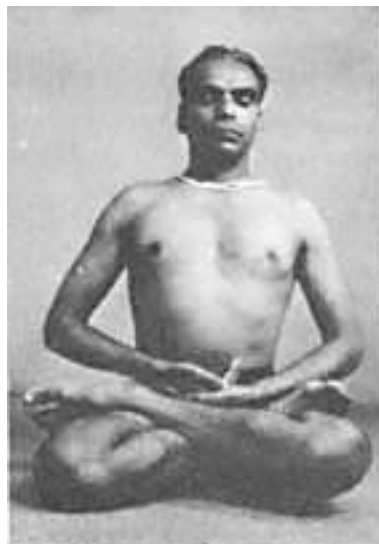
Б.К.С.Айенгар в позе падмасана

«Когда всматриваешься в сияющее солнце в гипофизе и при этом остаешься в позе «лотоса», вскоре чувствуется внутренний жар в основании позвоночника ( Муладхара ), который потом доходит до затылка. При переходе в позу горакиасана или если просто вытянуть ноги, этот жар прекращается. Он возвращается, если снова перейти в позу «лотоса».